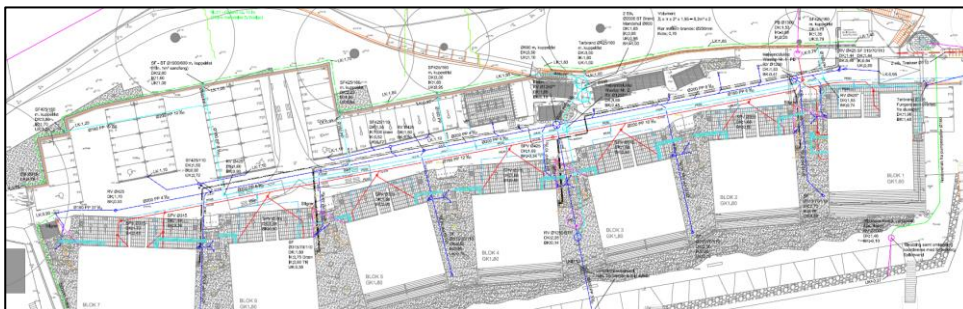
Figur 3: Kortudsnit, der viser drænen (grøn steg)

Overfladevand og grundvand afledes via nye dræn, som skal sikre, at der ikke kan ske skade på Thurinerhusene, se bilag 1.