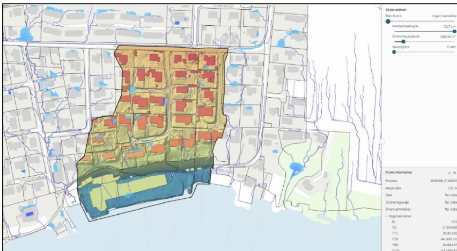
Figur 2: Opland, der afleder regnvand til projektområde

Området omdannes til boligformål, og i den forbindelse skal der håndteres regn/overfladevand fra skrående arealer nord for projektområdet. Jf. scalgo ledes der i alt 146 l/s ved en 20 årshændelse. Dette medfører større vandtryk på støttemuren, som etableres mod nord, op ad eksisterende skrant. Der skal derfor etableres en regnvandsløsning på bagsiden af støttemuren, som både håndterer overfladevand via sandfangs brønde med kuppelriste og grundvand via dræn, se bilag 1, tegning: TH_K19_H1_EF_N10 .