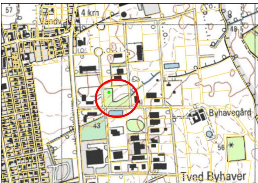
Figur 1 - oversigtskort

Svendborg Kommune opfordrer alle til at skrive sikkert via Digital post. Derfor bør du aldrig sende fortrolige personhenførbare oplysninger (CPRnr. helbreds- og økonomiske oplysninger) i en almindelig mail. Læs mere: https://www.svendborg.dk/om-kommunen/digital-post-og-selvbetjening