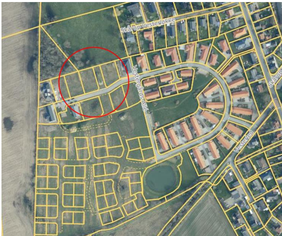
Figur 2: Luftfoto, der viser placering af lokalitet for forlægning af privat vandløb (rød cirkel)