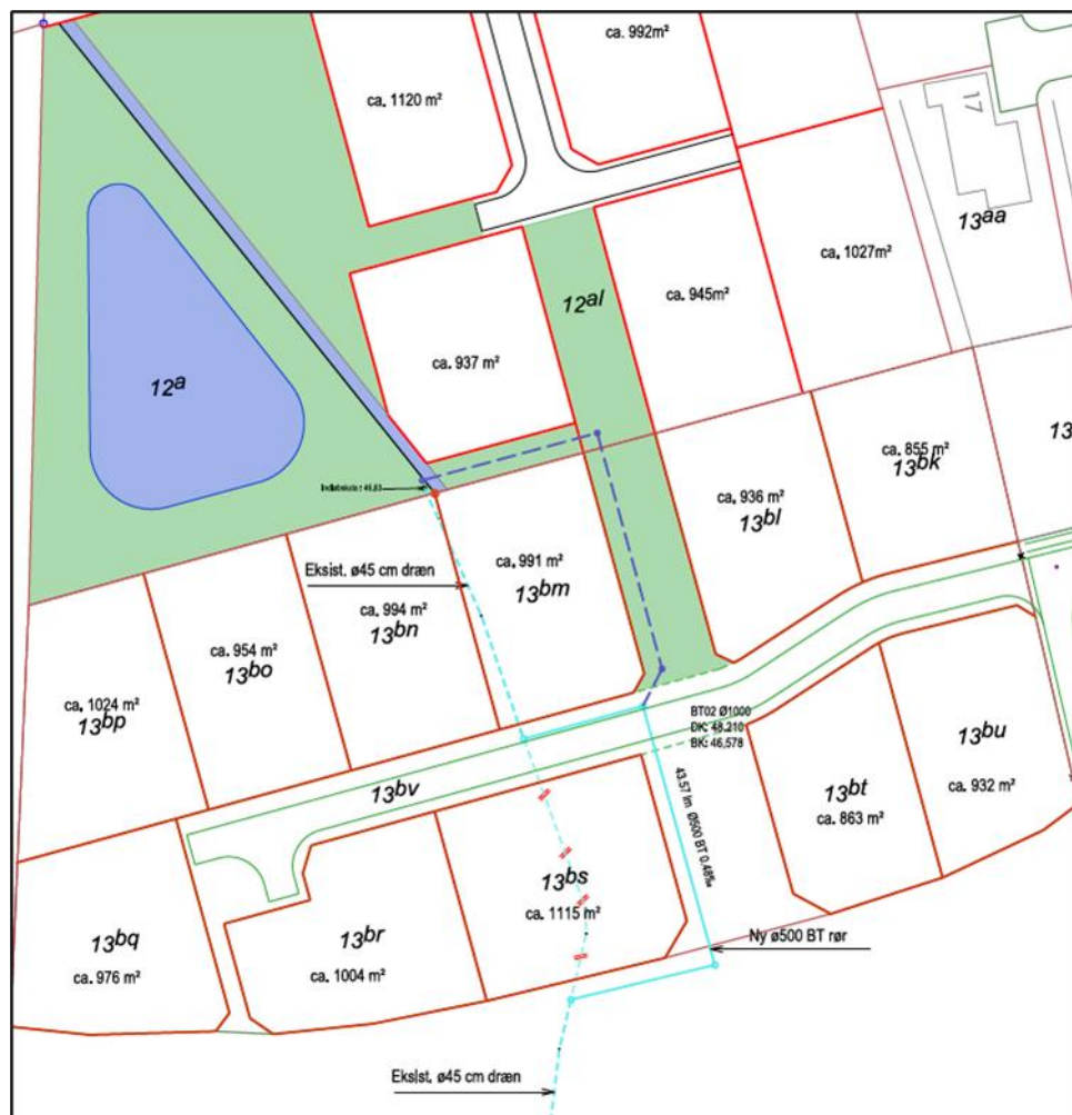
Figur 3: Eksisterende forløb (turkis) og fremtidigt forløb (blå stiple)

Vandløb forlægges over en strækning på ca. 55 m, se figur 3. Der anvendes Ø 50 cm mufferrør på strækningen. Det er ansøgers vurdering, at der ikke vil opstå hydrauliske problemer ved et skift til en større rørdimension over en kortere strækning.