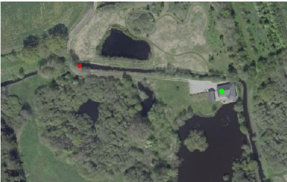
Figur 1: Oversigtskort med placering af krydsningen markeret med rød plet. Lundevej 19 er markeret med en grøn plet.

Ansøgningen vedrører krydsning af et Vejstrup Å med fiberkabel.