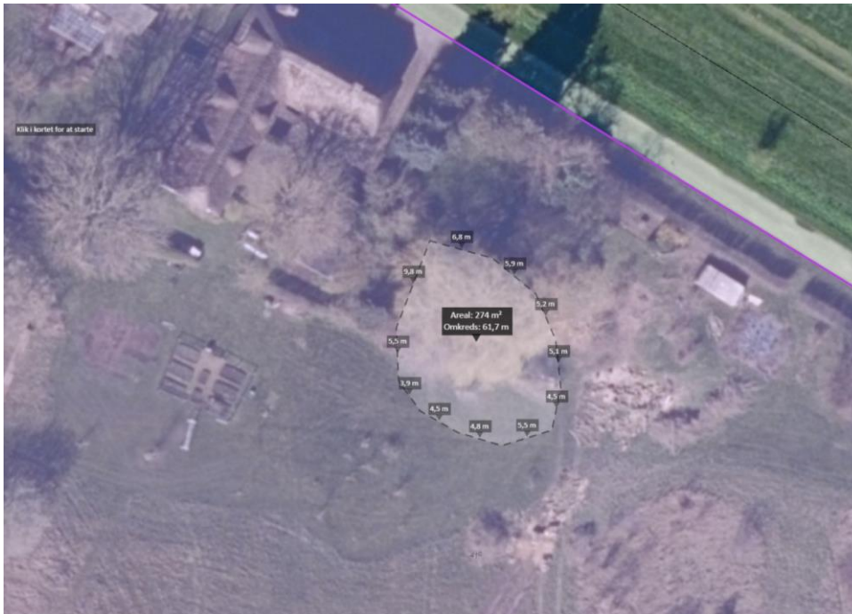
Figur 2. Luftfoto af adressen, hvor den ønskede placering og udstrækning af søen er indtegnet med stiplede linje.

Du har oplyst i ansøgningen, at de tre store træer på placeringen er væltet, og da I er ved at fjerne dem, vil I gerne etablere sø på området.