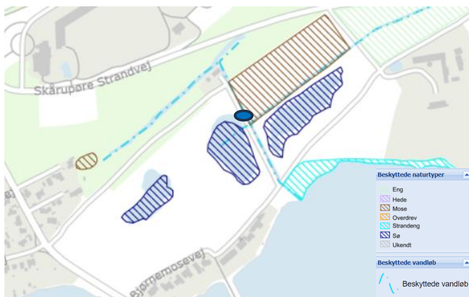
Figur 2: Kort som viser naturbeskyttede arealer nær projektområdet. Den blå ellipse viser hvor det nye vandløb krydser grusvejen.

Samlet set vurderer vi, at etablering af det nye vandløb ikke vil ændre tilstanden af de omkringliggende beskyttede naturtyper og projektet vil dermed ikke være i strid med naturbeskyttelseslovens § 3.