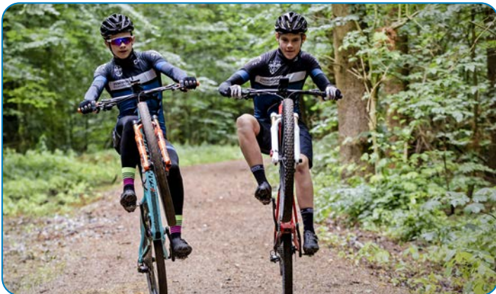
Venskaber opstår gennem et aktivt udliv.