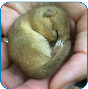
Hasselmusen ruller sig helt sammen, når den sover vintersøvn.