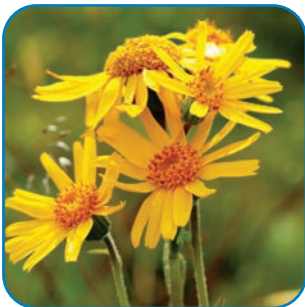
Guldblomme vokser i Rødme Svinehaver som det eneste sted i Østdanmark.