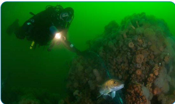
Dykker ved vrage.