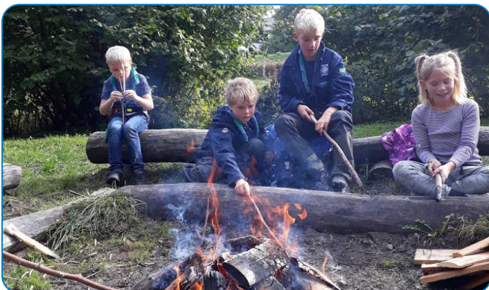
Christiansmindespejdernes minier laver mad over bål efter en lang gåtur i Vejstrup Ådal.