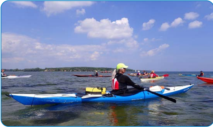
Sejlads i havkajak giver motion, naturoplevelser og fællesskab.