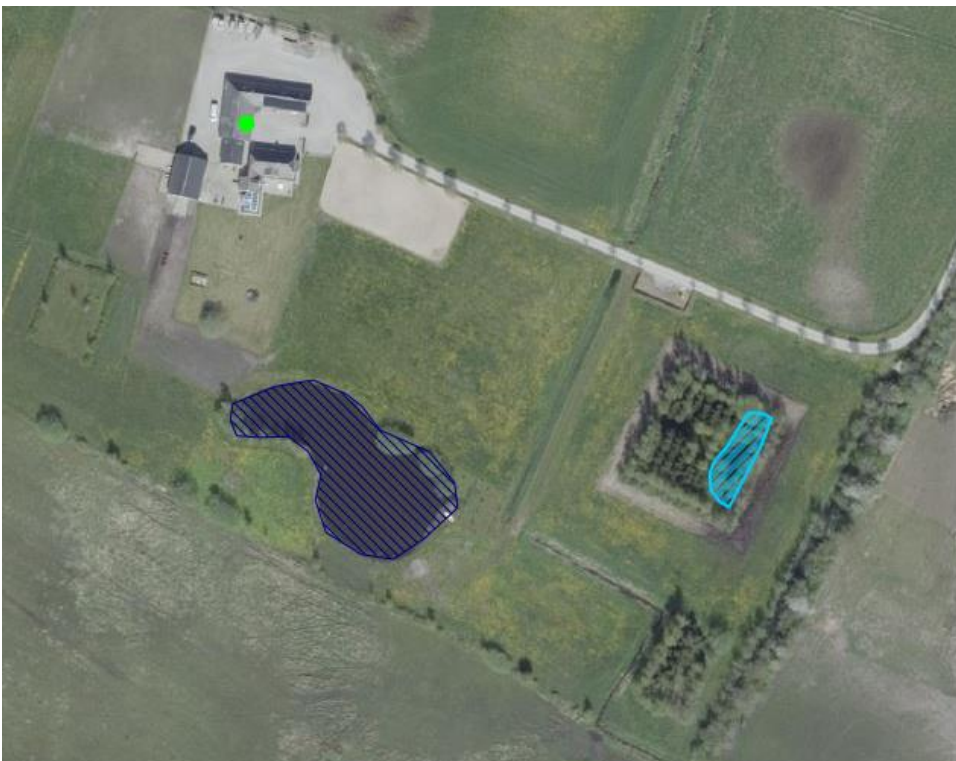
Figur 1. Luftfoto af matr. 10e Lakkendrup By, Gudbjerg. Søen der ansøges om lovliggørende landzonetilladelse til er skraveret med lyseblå. Grøn prik angiver Langholmsvej 8, 5892 Gudbjerg. Blå skravering angiver § 3-beskyttet sø.

https://www.svendborg.dk/om-kommunen/digital-post-og-selvbetjening