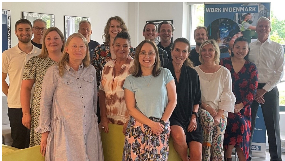
Workindenmark's hold af konsulenter

Workindenmark er en del af EURES – European Employment Services – som tæller mere end 1000 vejledere fordelt over hele